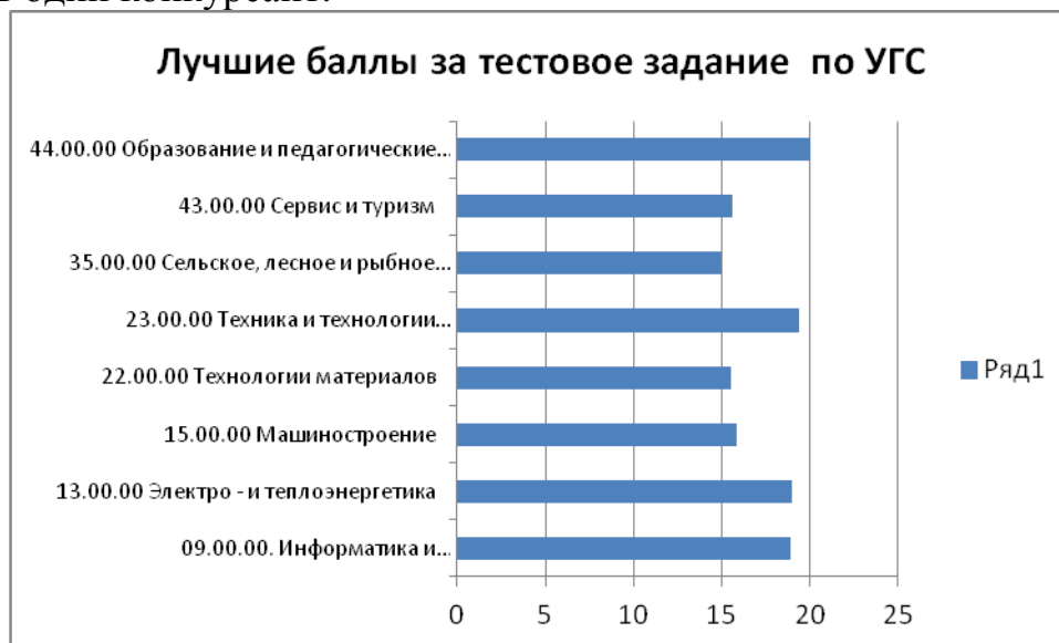
Рисунок 8- Максимальное количество баллов за тестовое задание по УГС

Из 92 участников максимальное количество баллов за тестовое задание набрал лишь один конкурсант.