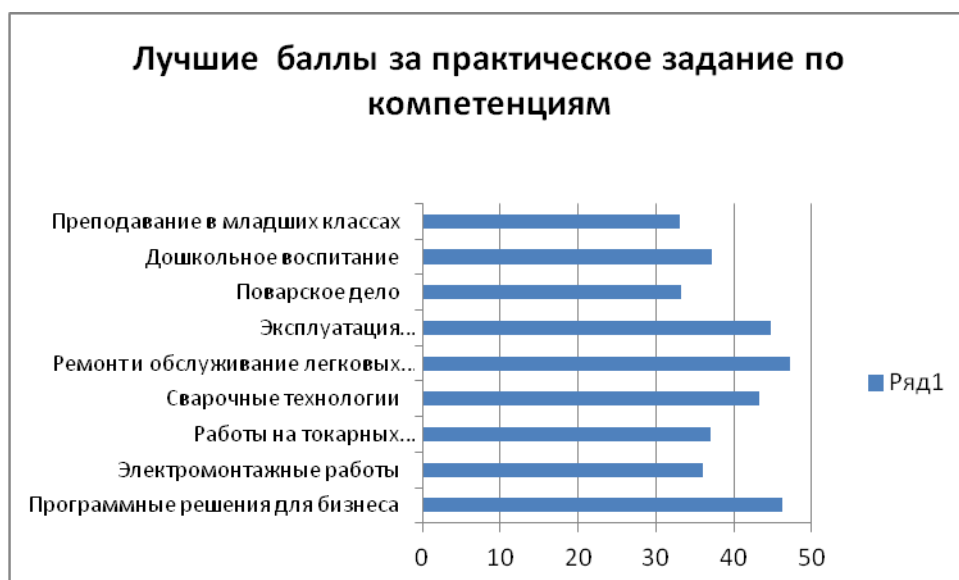
Рисунок 7- Максимальное количество баллов за практическое задание по компетенциям

Наибольшее количество баллов за тестовые задания по УГС, представленные в таблице 6.