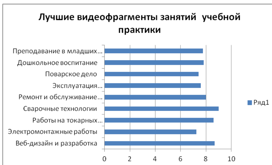
Рисунок 4- Максимальное количество баллов за видеофрагменты занятия учебной практики по компетенциям

Наибольшим количество баллов оценены публичные защиты самоанализа занятий учебной практики, представленные в таблице 4.