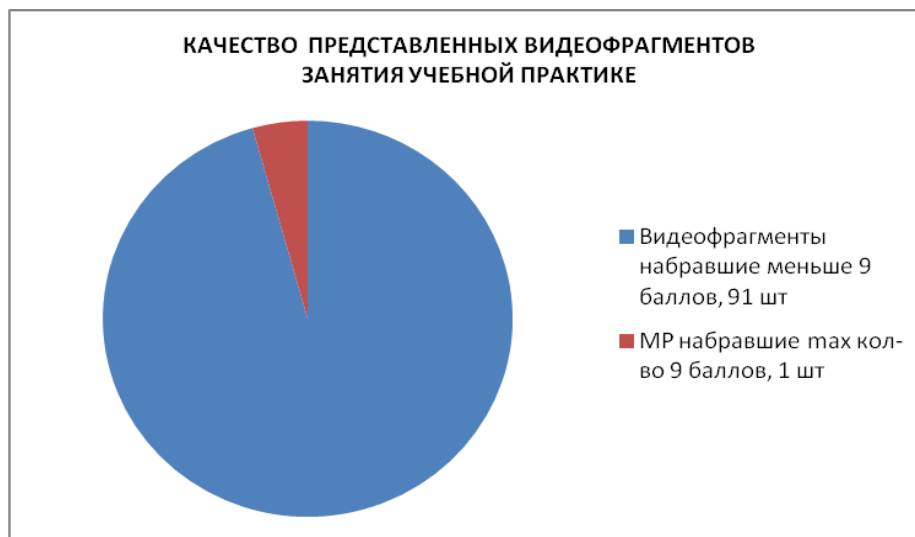
Рисунок 3- Качество представленных видеофрагментов занятия учебной практики