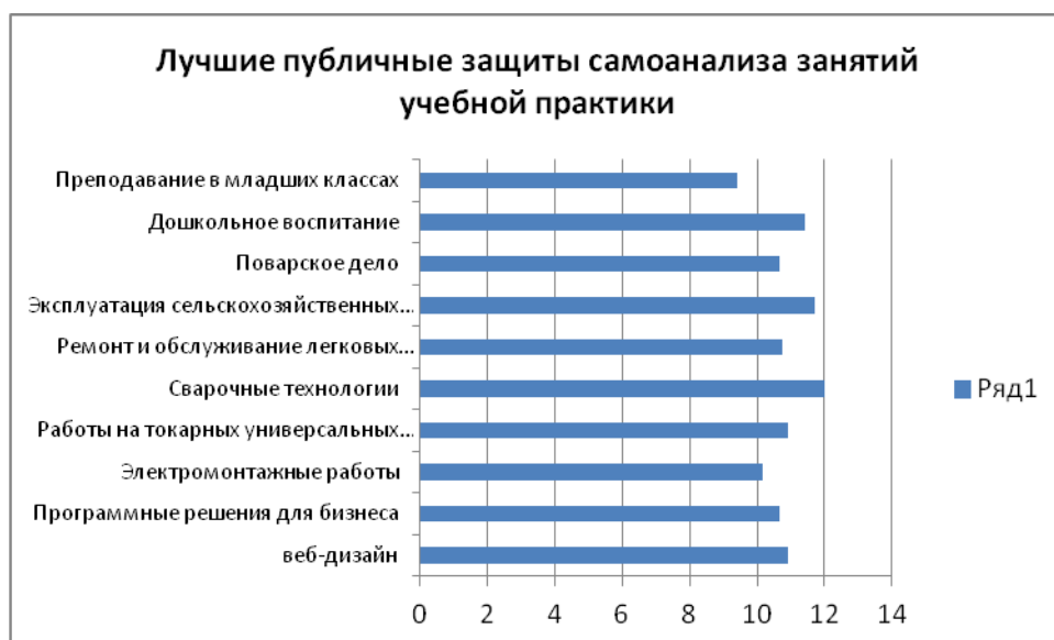
Рисунок 6- Максимальное количество баллов за публичную защиту самоанализа занятия учебной практики по компетенциям

Наибольшим количеством баллов оценены практические работы комплексного задания, представленные в таблице 5