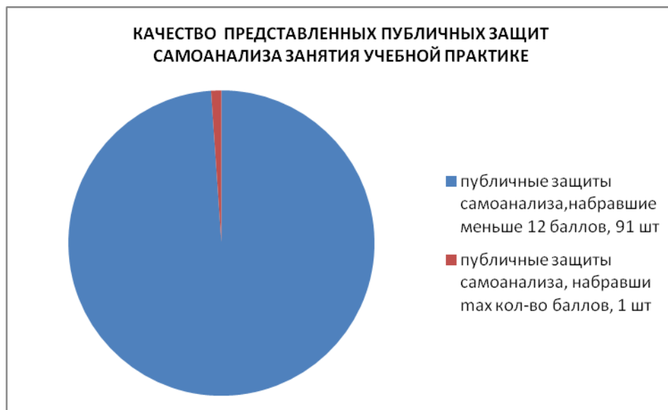
Рисунок 5- Качество представленных публичных защит самоанализа занятий учебной практики